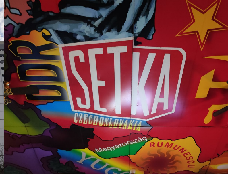
Poznat kulturu daného místa – architektura, historie, muzea, kavárenský život, bary...