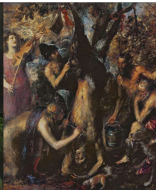
d) Tizian, Apollón a Marsyas