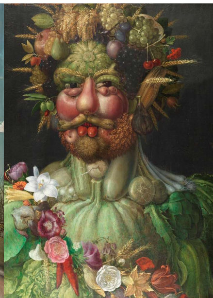
c) Giuseppe Arcimboldi, Rudolf II. jako Vertumnus