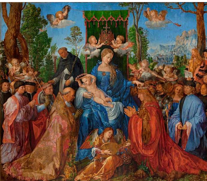
a) Albrecht Dürer, Růžencová slavnost