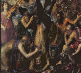
3 a b c d