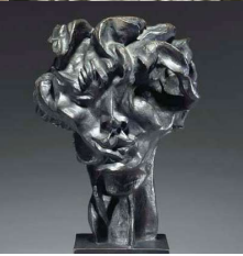
10 a b c d