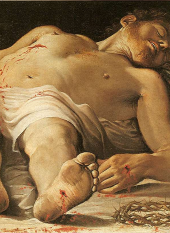
8 a b c d