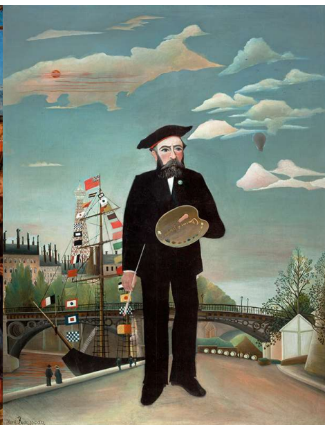
b) Henri Rousseau, Já, portrét – krajina